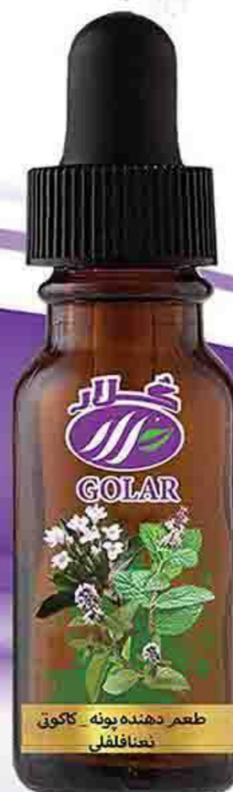
پونه - کاکوتی - نعنا فلفلی