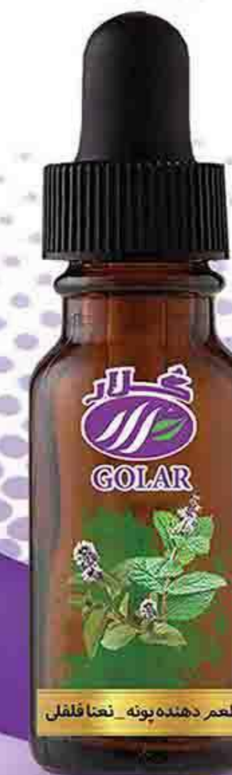
پونه - نعنا فلفلی